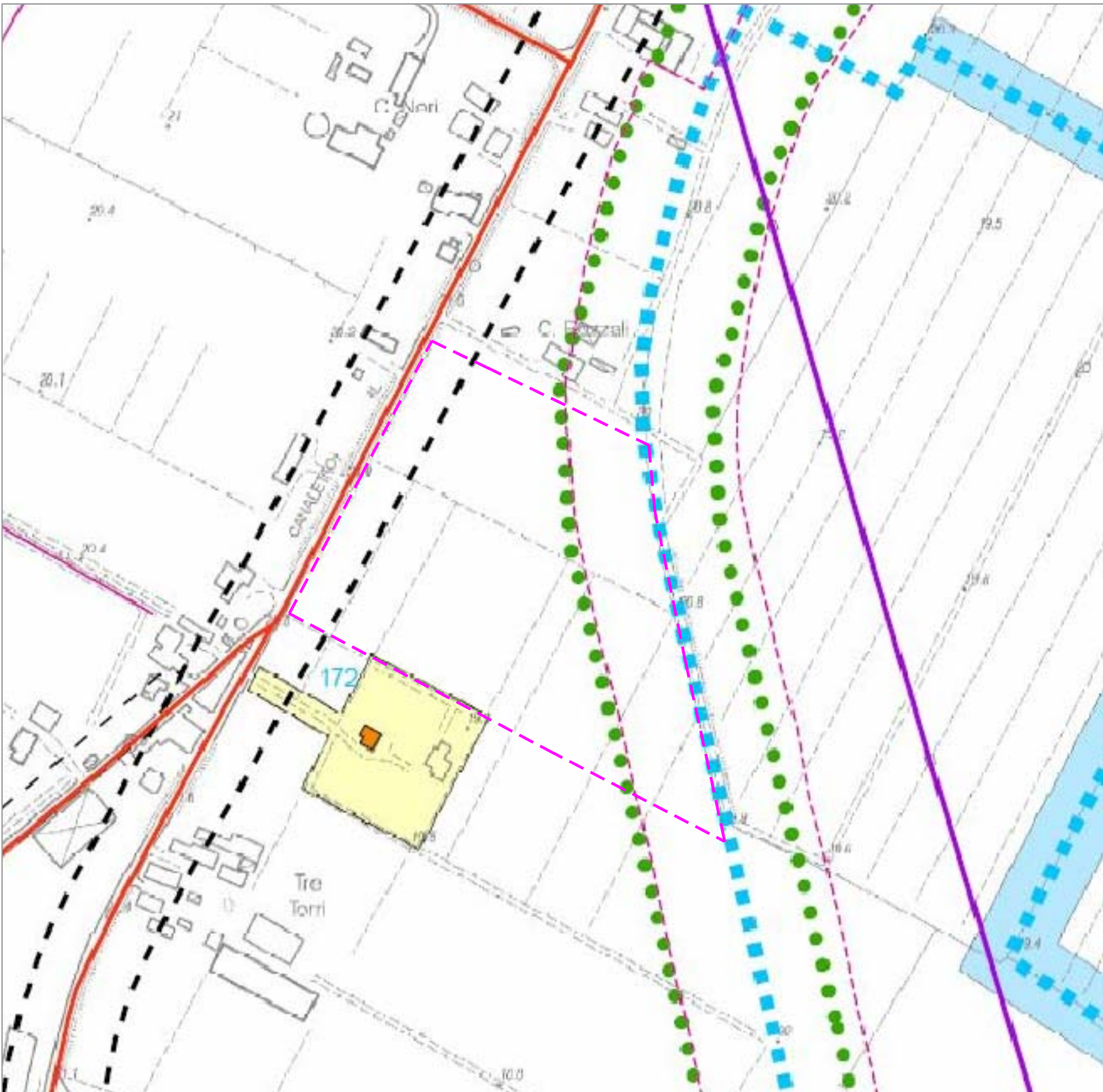
Estratto PSC - Carta dei vincoli e delle tutele