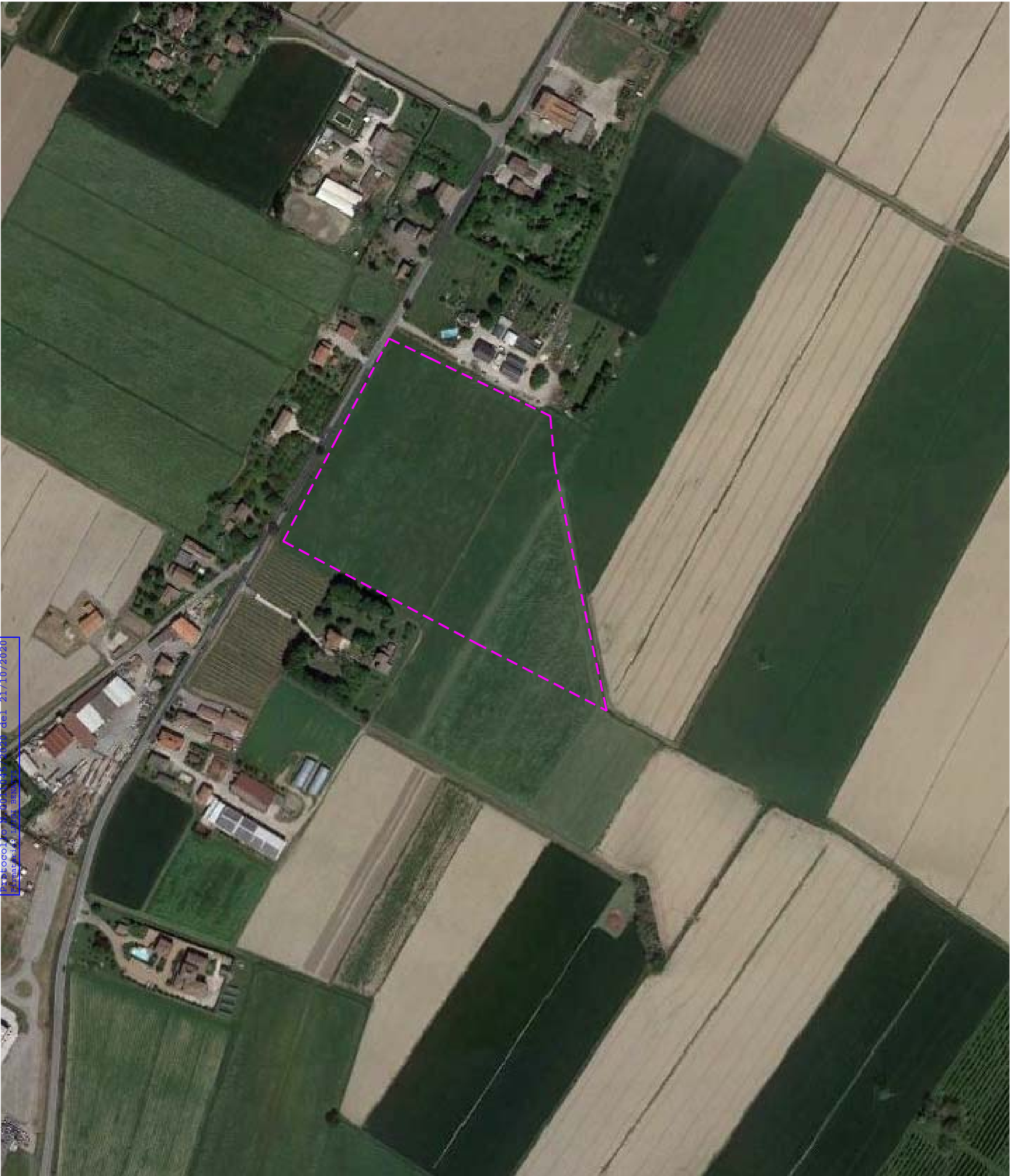
Individuazione area di intervento - vista aerea - scala 1:2000