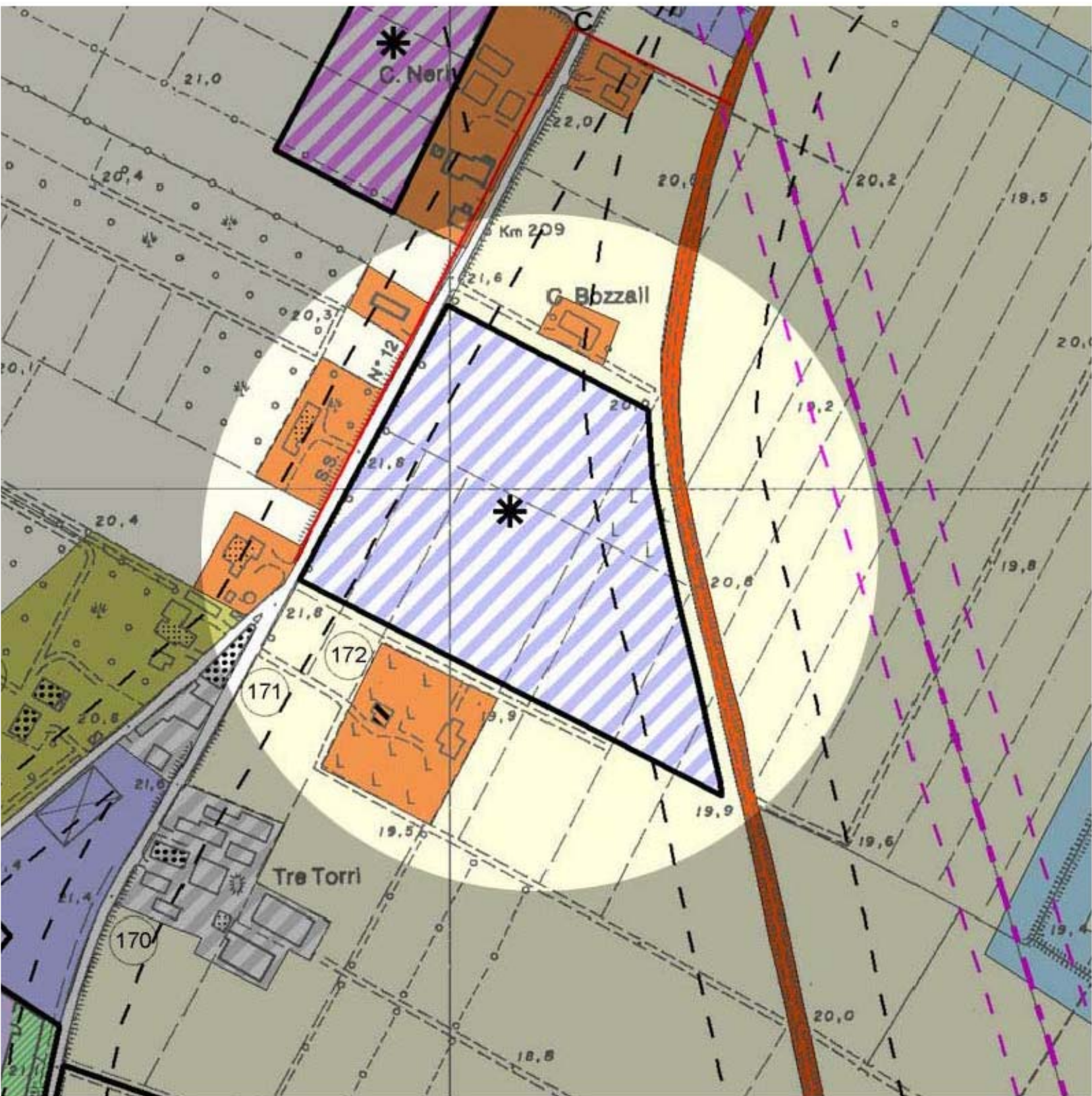
Estratto PRG - Variante parziale al 2005 art.14